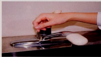
7. 水道の栓を止めるときは、手首か肘で止める。できないときは、ペーパータオルを使用して止める