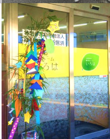
(上段左) 制作例 (上段右) 避難訓練にて / (下段左) コミュニケーションカード (玄関前) (下段右) セタまつり