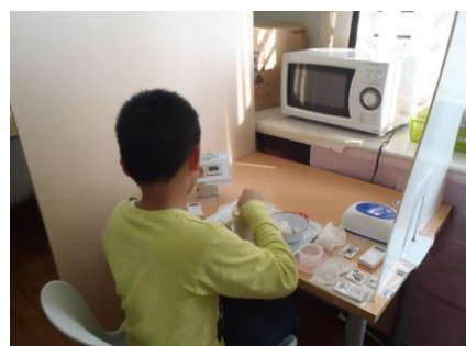
↑ 手順書を使っておやつ作り