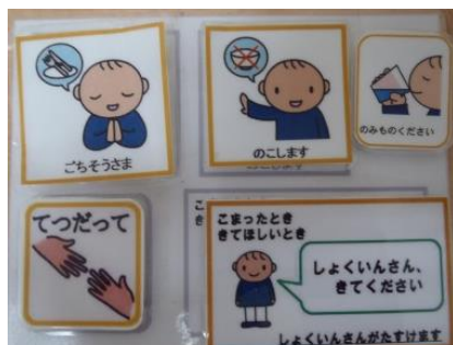
↑ コミュニケーションツール